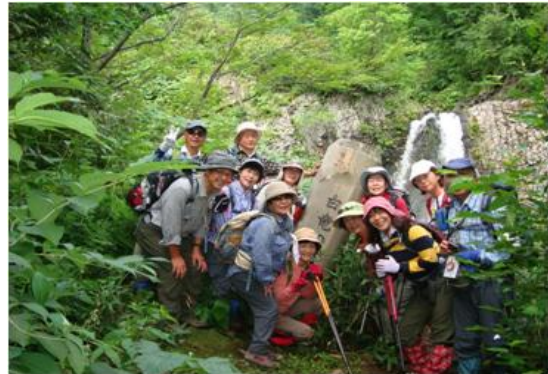
途中の「白竜の滝」立派な滝でした