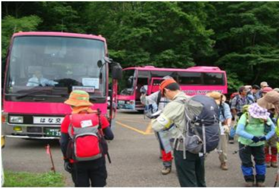
バス(中型)2台、45人の参加、ゲートパーク駐車場