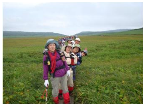
B班のチームワーク、歌いながらポーズ