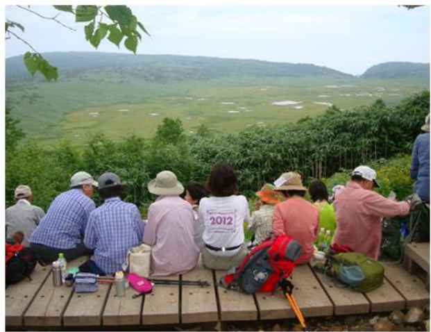
雨竜沼湿原展望台から見た広大な湿原、早くも秋模様。皆さん飽きる位？堪能しました