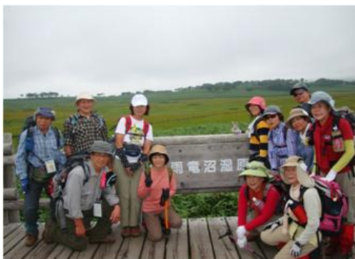
「雨竜沼湿原に来た」証拠写真です