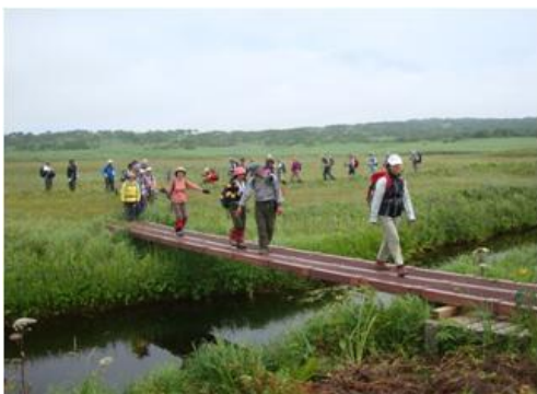
スタッフの親切なガイド付き散策です