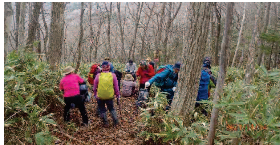
北山沢コースと南峰尾根コース分岐