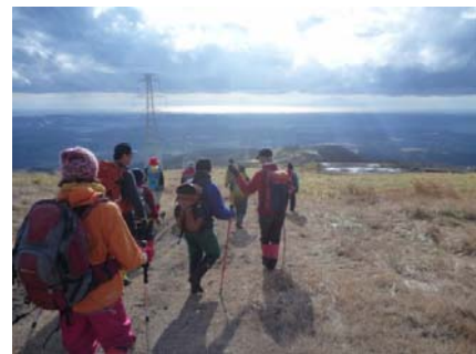
中腹から噴火湾を望む

黄金岳への道々は中腹まで大型作業車が通行可能な道 路が走り、広く整地もされ発電用風車敷設事業が着々 と進んでいる。今は土がむき出しになっているが数年 後には、中低木と笹竹が茂る明るく優しい斜面に、海 からの風を受けて、白い風車がゆったりと回る風景が 作り出されるのだろう。