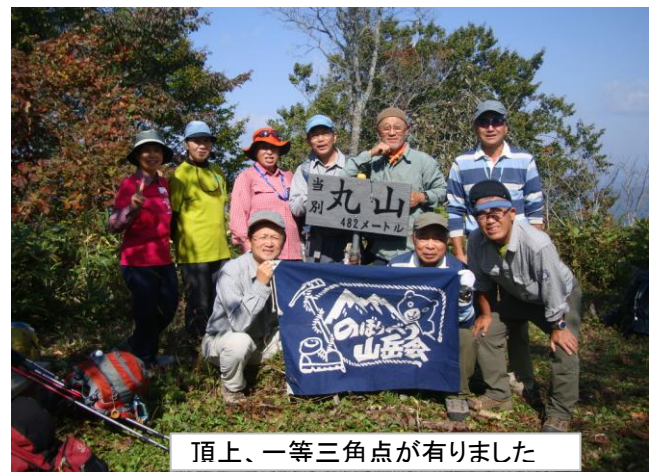
頂上、一等三角点がありました

登っていくと展望台分岐があり、それから傾斜が次第にきつくなり頂上はまじかと思うのだが中々頂上に着かない。標高が低い割には結構な山だ。やっと頂上到着。標識の裏側にロザリオが掛かっている信者さんが置いて行ったのだろうか。全員初めての山、函館山の景色を見ながら下山。