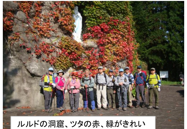
ルルドの洞窟、ツタの赤、緑がきれい

秋晴れの天気の中、伊達道の駅を出発。予定時間より早く、渡島当別のトラピスト修道院に着く。明日の大千軒岳登山の足慣らしを兼ねて約500mの丸山に登る。登山口は修道院の裏で、広い駐車場？に車を止め、準備体操後出発した。「ルルドの洞窟」看板から歩き始め、信者の墓地横を通り杉林に入っていくと、ほどなく洞窟に着く。洞窟はツタが這っていて美しく紅葉している。6人位の見学者がいる。ここから狭い登山道、昔の薪運び等に使用した道路跡らしい。