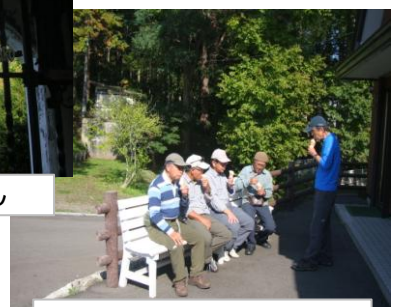
男性軍全員ソフトクリームなめ