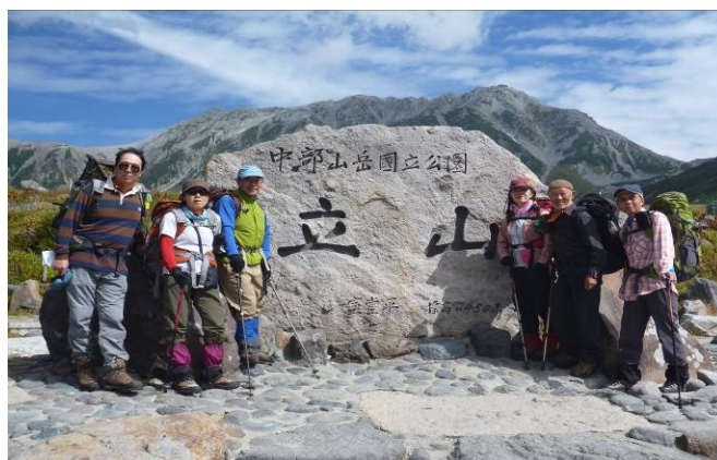
登山前の元気な姿、バックは立山