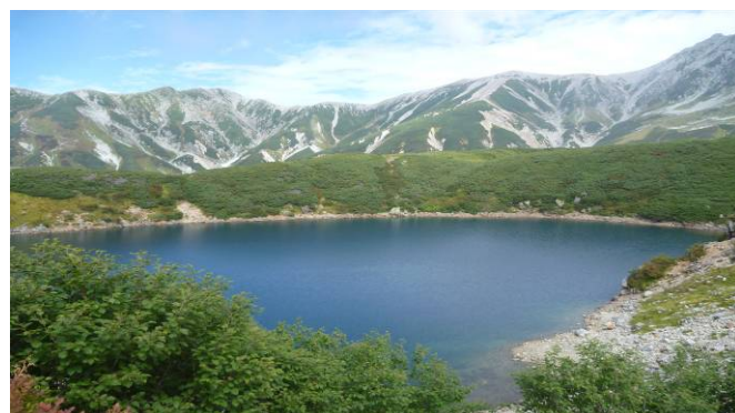
みくりが池、左端に別山乗越の登山道が見える