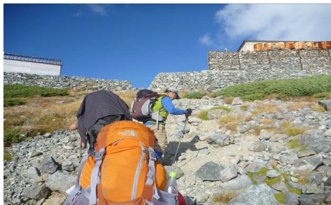
別山乗越、劔御前小舎までもう少し