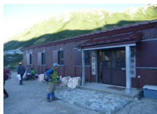
劔沢小屋、料理は最高

夕食はビーフシチュー、エビフライ、春巻き、冷ややつこの豪華メニュー、お酒を飲まず？7:40 就寝。