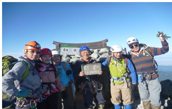
劔岳山頂（頭だけは3,000mを越えた）

夕食はビーフシチュー、エビフライ、春巻き、冷ややつこの豪華メニュー、お酒を飲まず？7:40 就寝。