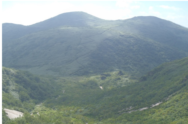
珍しい高山植物が多くモウセンゴケなどが見られる